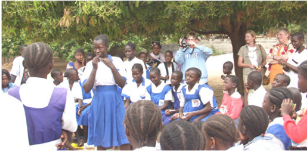
Unterricht im Freien wegen fehlender Schulgebäude Bayerische Gäste als gern gesehene Beobachter