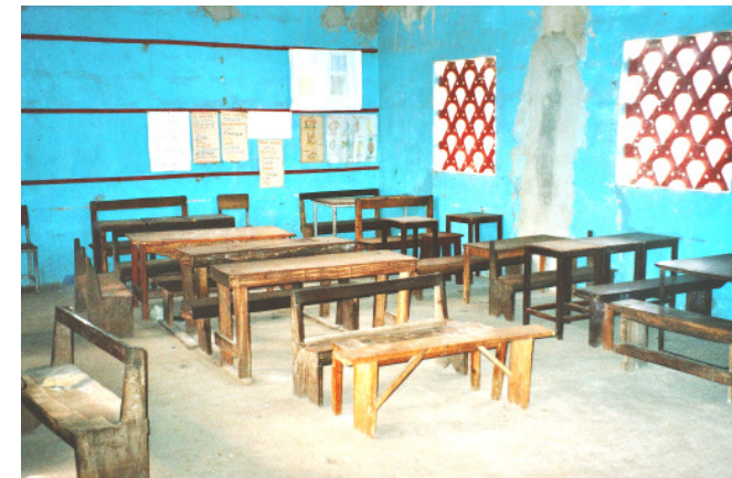
Blick in einen Schulraum

Das Schulsystem ist nach britischem Vorbild aufgebaut. Jedoch besteht keine Schulpflicht. Die Primary School (Grundschule) geht von der 1. bis 6. Klasse. Die Einschulung in die 1. Klasse erfolgt mit 7 Jahren. Zuvor besuchen die Kinder vom 4.-6. Lebensjahr 3 Jahre die Nursery School (Vorschule), in der sie auch die englische Sprache perfekt lernen. Am Ende der 6. Klasse müssen Prüfungen abgelegt werden. Die Middle School beinhaltet die Klassenstufen 7 bis 9. Hier müssen jährlich Prüfungen abgelegt werden. Die High School geht von Klasse 10 bis Klasse 12 und schließt mit dem A-Level-Examen ab (Abitur), welches zum Universitätsstudium berechtigt.